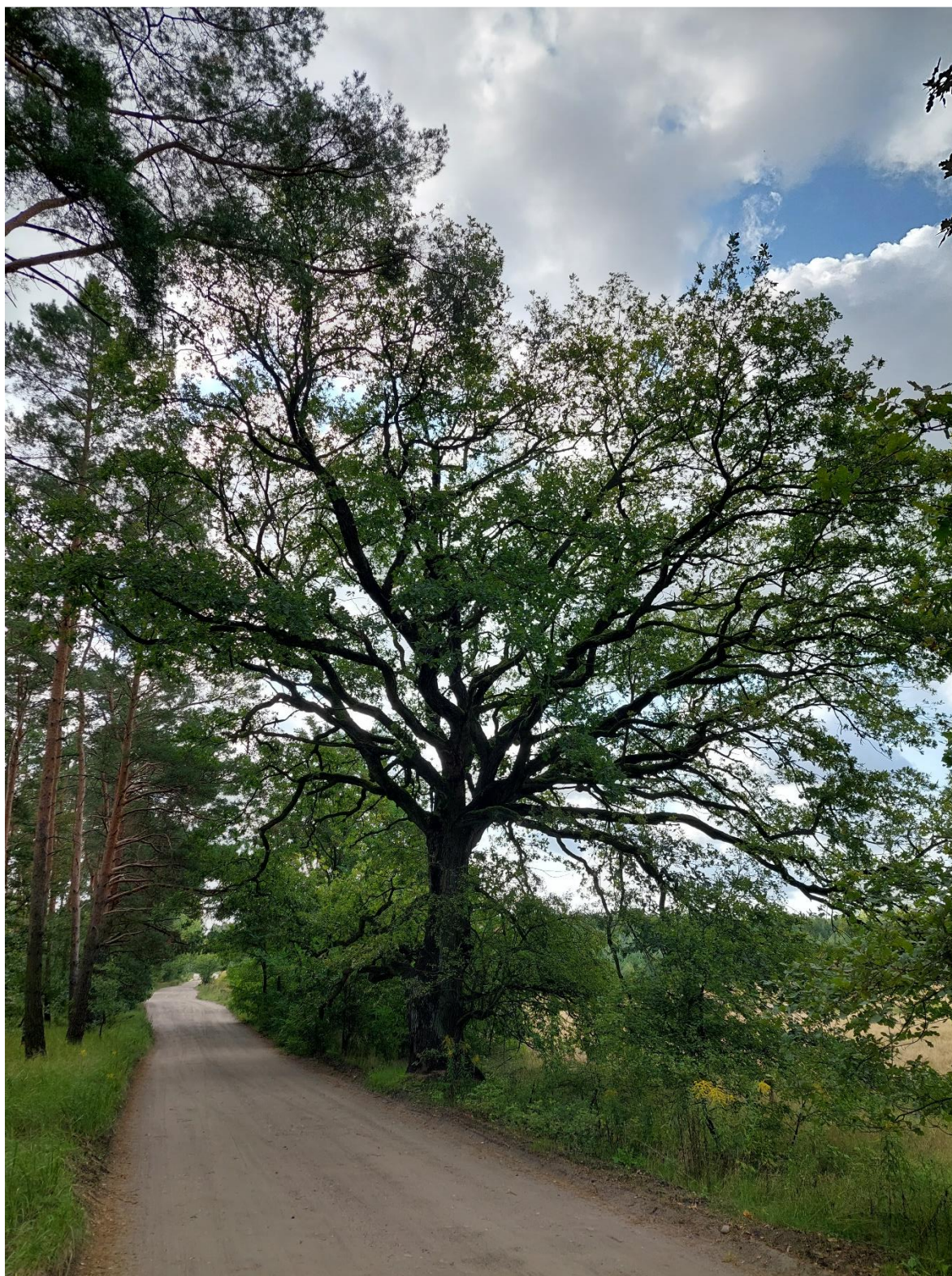
Fot. 1 dąb szypułkowy Otowo