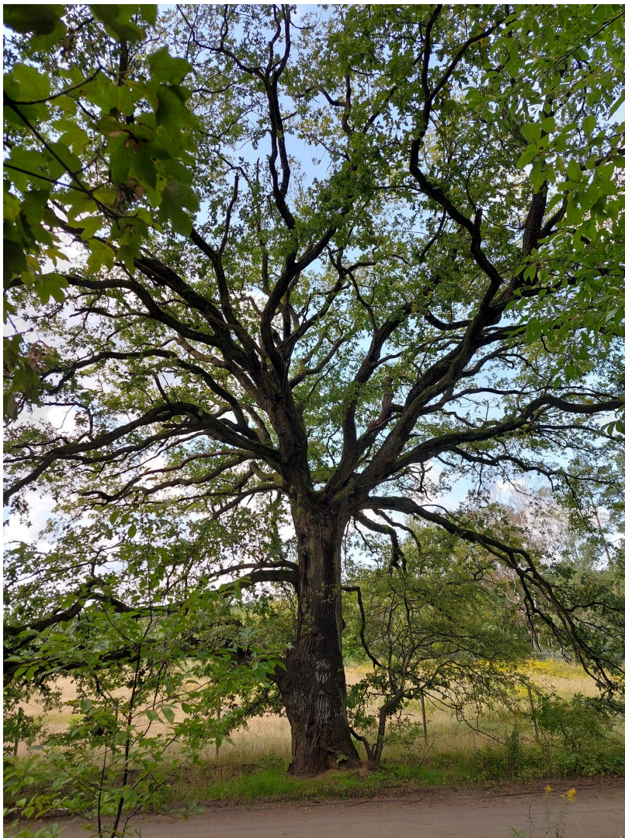
Fot. 2 dąb szypułkowy Otowo